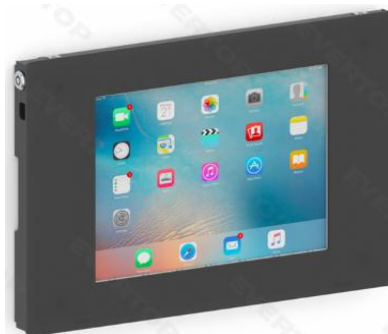
Hình 1 – Hình ảnh thực tế của hộp thông minh

được gửi đến, sinh viên sẽ tương tác và phản hồi thông tin này thông qua các hộp thông minh.